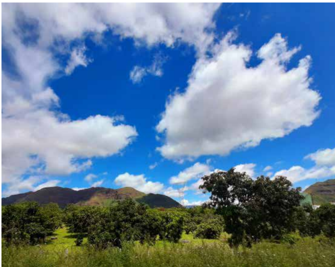
Donde las nubes tocan las montañas.

Múltiples climas y ecosistemas, como consecuencia a sus condiciones geográficas, convirtiéndose en una zona de conservación de la biodiversidad mundial. La