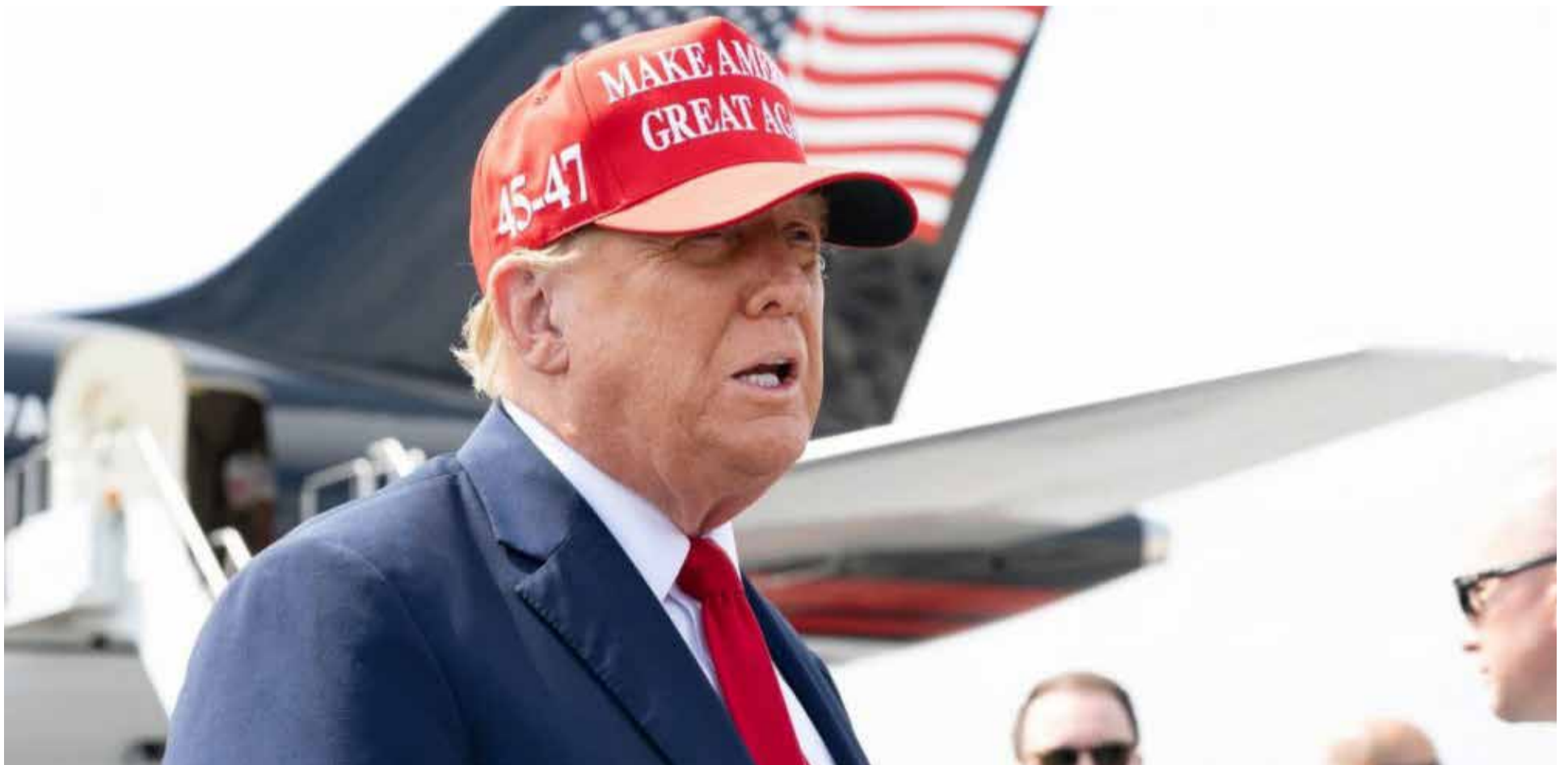
Donald Trump, candidato presidencial de los Estados Unidos