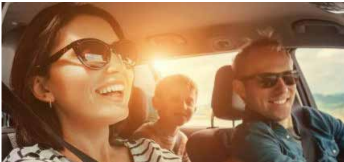
Los papás suelen ser los máximos referentes en los hábitos de conducción de sus hijos a futuro, sobre todo, en lo que respecta a la seguridad vial.

El uso del cinturón de seguridad es, probablemente, la norma más elemental de seguridad pasiva al volan-