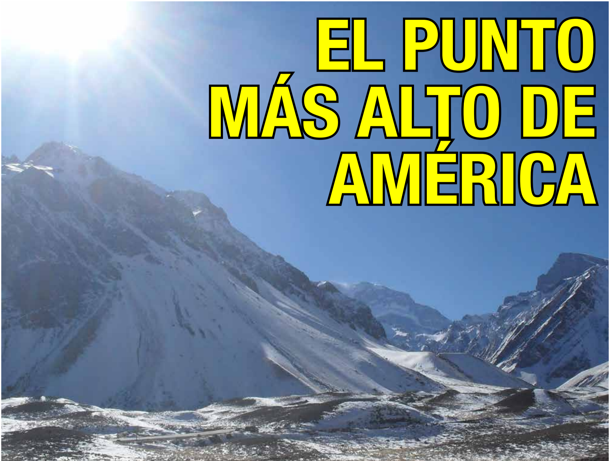
Panorama de la cordillera Central desde la Isla del Sol en Bolivia.