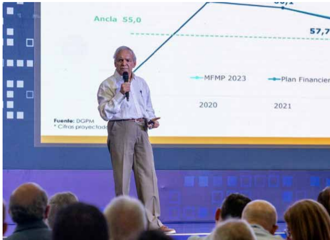
El ministro de Hacienda, Ricardo Bonilla, lidera la Ley de Financiamiento.