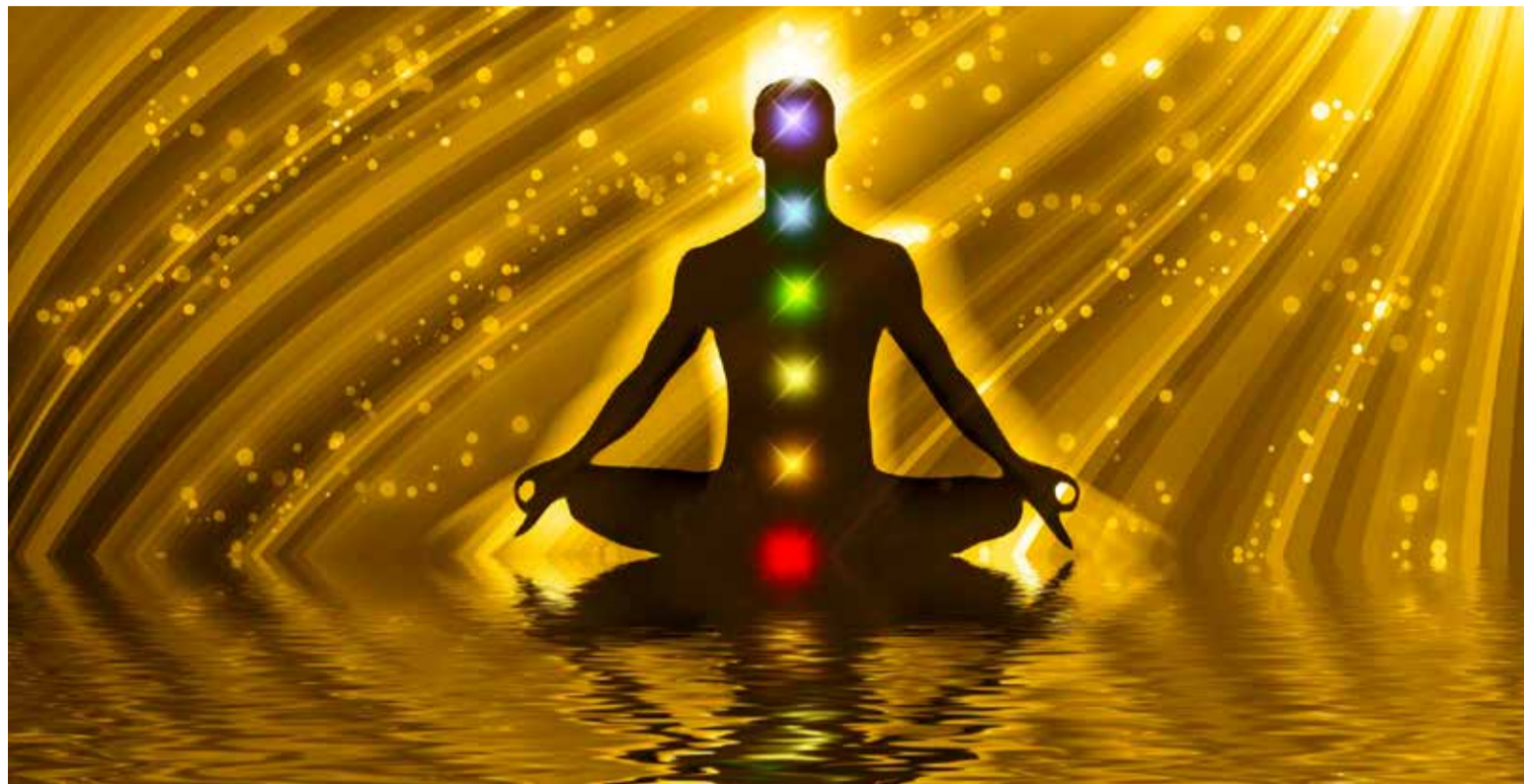
Nacemos con seis sentidos: la vista, el olfato, la audición, el tacto, el gusto y la intuición o percepción extrasensorial (PES).

Por eso, una de las funciones más importantes del cerebro y las redes neuronales es el razonamiento, contrario al cuerpo que con sus impulsos generados por el sistema límbico estimulan el instinto y durante la interacción del preconsciente y el inconsciente del individuo, se activa la intui-