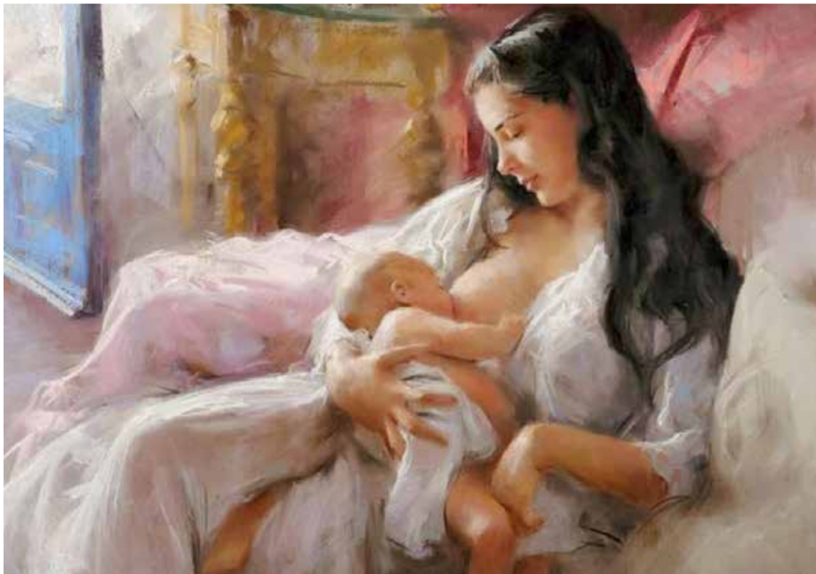
RETRATO-AL-OLEO-DE-MAMA-Y-BEBESolo una madre puede amar a una piraña, porque tu hijo será odiado por todos, menos por ti.

«Mira —le dijo Dios— este hijo es un alma orgullo-