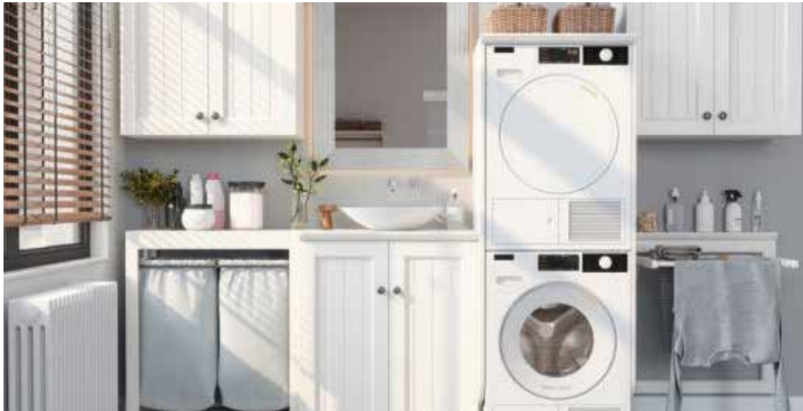
En especial, la combinación de lavadora y secadora todo en uno es ideal para hogares modernos, ofreciendo múltiples beneficios que te harán la vida mucho más fácil

T ener una lavadora y secadora en casa no es solo una comodidad, sino una necesidad para mantener el orden y la limpieza del hogar. La tecnología ha avanzado tanto que ahora es posible contar con un centro de lavado completo, que no solo te ahorra tiempo, sino también espacio. Ahorro de espacio y eficiencia en el hogar